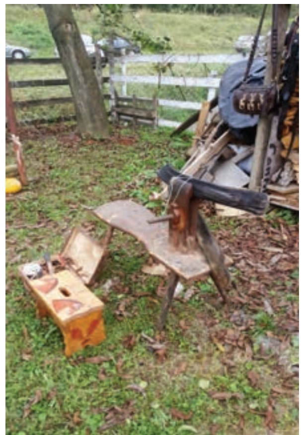
Klupica za krpanje orme