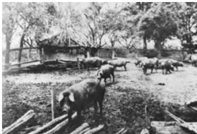
Strošinci, prišumski stan

Seljaci uopće nemaju žitnice, gumna, staje i tavan za skinuti usjev, kao ni za slamu, sijeno i otavu. Zbog toga moraju svoj dobiveni blagoslov čuvati pod otvorenim nebom te ga prepuštati na milost i nemilost svinjama i volovima, kao i insektima i silnim rojevima vrabaca, vrana, gavranova itd. Osim toga upropaštava vlažna i kišovita jesen neobično mnogo žita koje proklija. Često se može vidjeti visoko složenih hrpa neovršenih žitarica koje su tako zeleno obrasle kao da su obložene travom. Vršidba traži mnogo ruku, vremena i rada te se mora u tako slabo naseljenoj zemlji kao što je Slavonija obavljati konjima i volovima. No na taj način se upropasti mnogo žita jer konji smrve i zgnječe mnoga zrnja ili zabiju u meku zemlju. A i slama se na taj način tako izlomi, da je takva gotovo neprikladna za krmu, zbog čega se stoci mora davati neovršena slama (F. W. Taube 1777: 40–46).