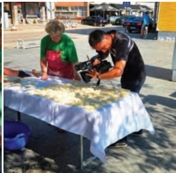
Gotovo redovno događaje u organizaciji Udruga Đeram poprati Vinkovačka plava televizija pa je tako i ovaj put ostalo medijski popraćeno.