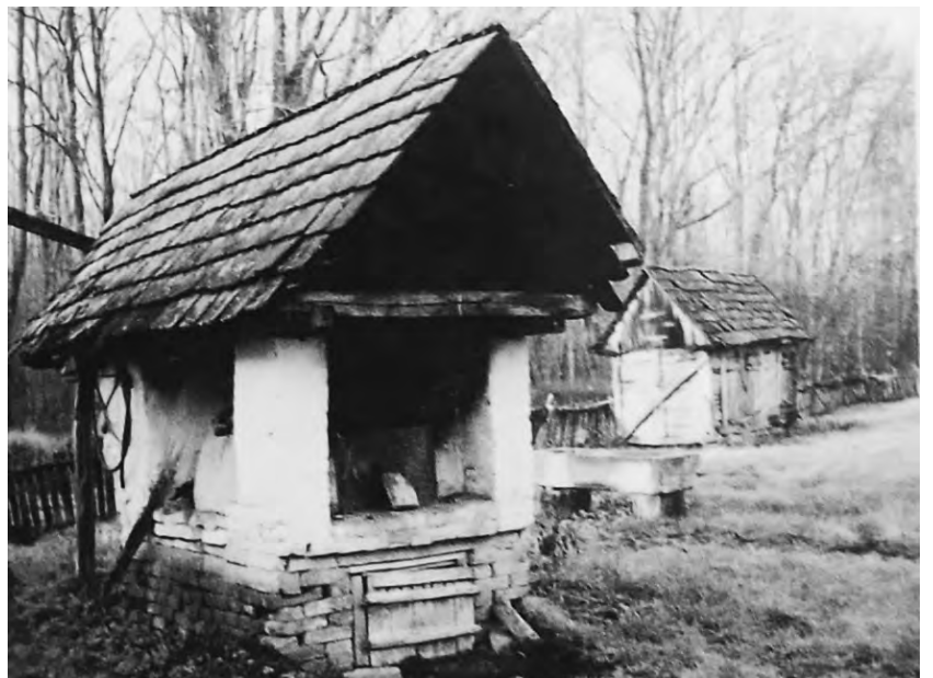
Stanarska vanjska peć

obično govorilo, za pranje „rubina” poslije „luženja”. Ljeti se često lužilo nedaleko bunara. Tu je bio i valov za napajanje konja, a za svinje je poseban valov na zemlji, dok su goveda imala poseban valov pokraj bunara u okolu, odnosno pokraj njega. Radi hladovine bilo je nedaleko bunara pokoje stablo, a najčešće po jedan ili dva „veza” (drvo slično brijestu) s čijih se mladih grana gulila kora, kojom se vezao lan. Oko bunara bilo je prilično uredno jer su valovi za stoku bili izvan ograde, a unutar dvorišta bila su samo korita za pranje.