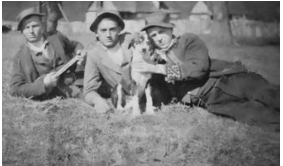
Čobani na stanu 1930-ih godina

U zadrugama je život bio podnošljiv jer je bilo dovoljno radne snage, a rad je bio podijeljen te je svaki imao svoj određeni posao. Dozvolom starješine mogao je pojedini član otići s posla radi svojih osobnih potreba. To nije ometalo posao jer su preostali članovi zadruge posao posvršavali i bez njega. Dok je bilo reda, poslušnosti i sloge i dok je državna vlast o svemu tome vodila računa, zadruge su napredovale i život u njima bio je dobar i nije bilo oskudice ni siromaštva.