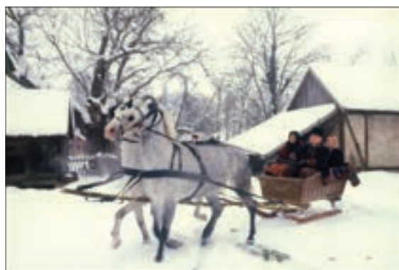
Stanarska zimska idila