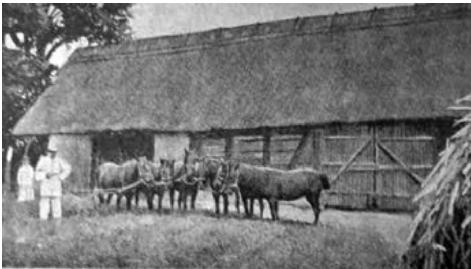
Vršaj na stanu

Josip Lovretić (1865. – 1948.), zapisivač etnološke i folklorističke građe, također je u svojoj knjizi Otok (1897.) opisivao stanove i kazuje da je prije svaka kuća imala svoj stan. To je kuća u polju, blizu kakve šume. Preko ljeta čuvala se marva. Mnogi su stanovi imali svoje avlije koje su ograđene (tarabom, plotom), usađeno je kakvo drvo zbog hladovine, pa onda bunar sa stubnjem i đermom. Detaljno opsuje kako je stanarska kuća zidana, njezin vanjski i unutarnji izgled te namještaj i pribor za jelo. Građeni su okoli i pojate za marvu. U avliji je bio rov, u kojem se zarovila hrana za zimu. Bašća se održavala, u njoj je bilo posađeno ono što se koristilo za hranu, a viškove su poneki i prodavali. Mnogi su stanari pčelarili. Cvijeće je uljepšavalo cjelokupni prostor i življenje (J. Lovretić 2016: 47–51).