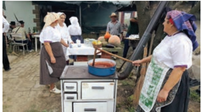
Pečenje pekmeza od šljiva