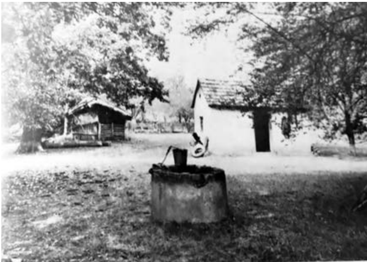
Strošinci, prišumski stan

Ante Knežević stanove je razvrstao na nekoliko tipova: po vremenu nastajanja, po razvijenosti (razvijeni, nerazvijeni, srednje razvijeni), po namjeni, po smještaju (podšumski, utvajski, krajvodni, njivski), po uporabi i po obitavanju. Sve ih je pomno i iscrpno opisivao. Zlatno doba stanova i stanarenja bilo je 19. stoljeće. Navodi nekoliko razloga propadanja stanova: ukinuće kmetstva (1848.), zabrana pašarenja i žirenja (oko 1880.), komasacije (u Županji 1938. – 1940. te 1965.), konfiskacije i nacionalizacije zemljišta i zgrada, izgradnja putova, željeznica te razvoj mehanizacije, odnosno smanjenje potreba za radnom snagom.