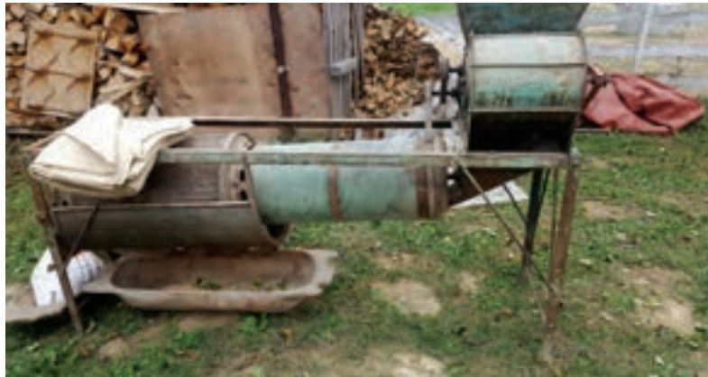
Trier za čišćenje žita od korova za sjetvu