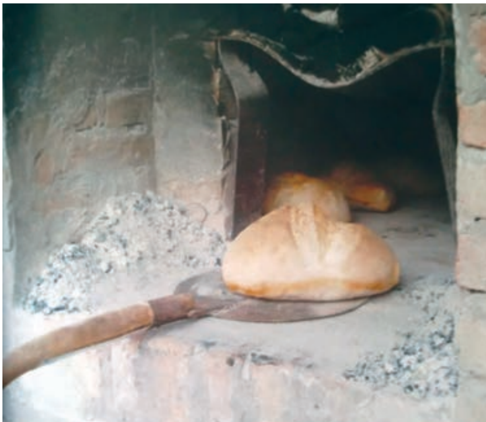
Nabrekli, veliki, mirisni kruz iz vanjske peći