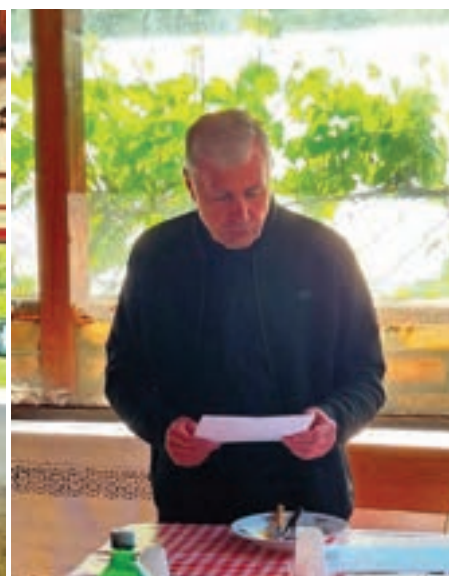
Izvjješće Nadzornoga odbora