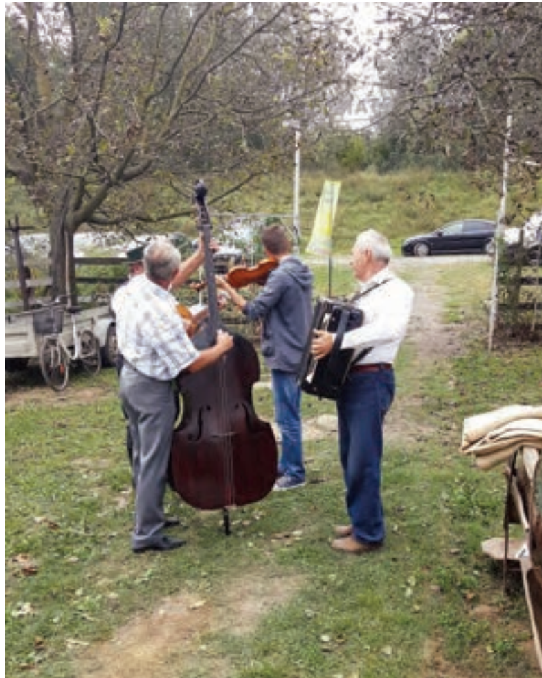
Poslovi završeni, a stigli i svirci. Još samo da se uštima i fešta može početi.