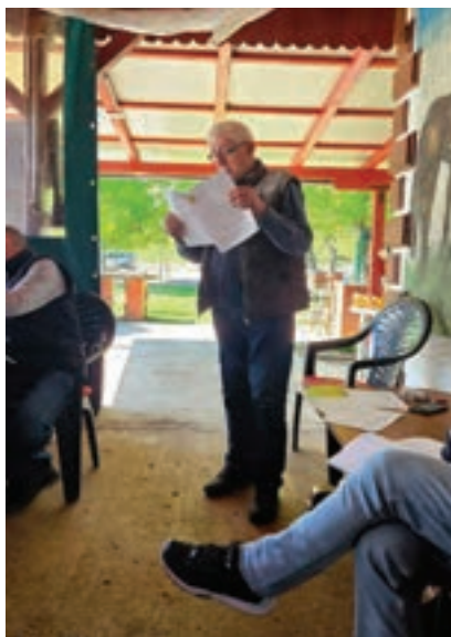
Izvjješće o radu