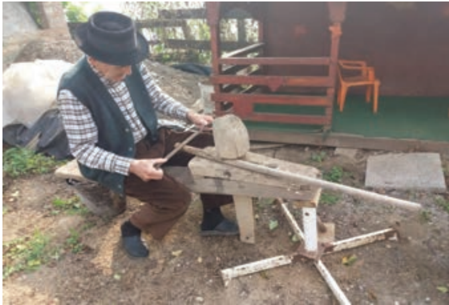
Popravljanje drţalice za motiku