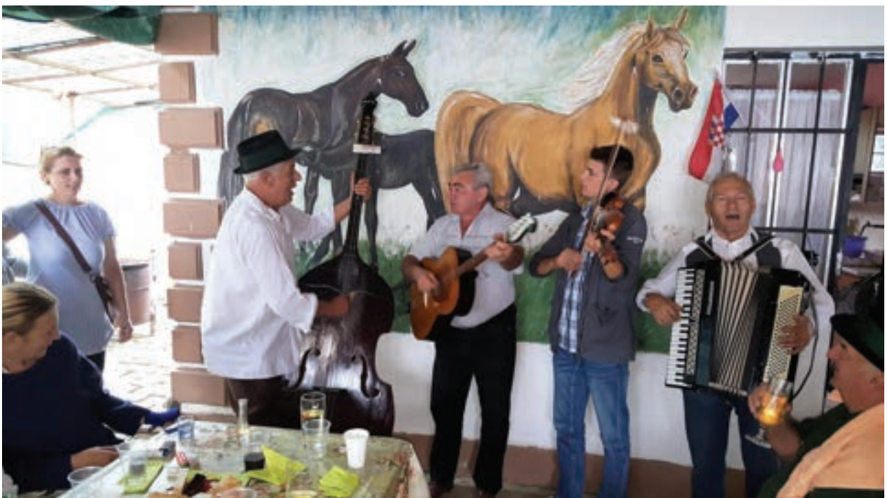
Domaćin je očito zadovoljan obavljenim poslom dok se uhvatio basa i zapjevao.