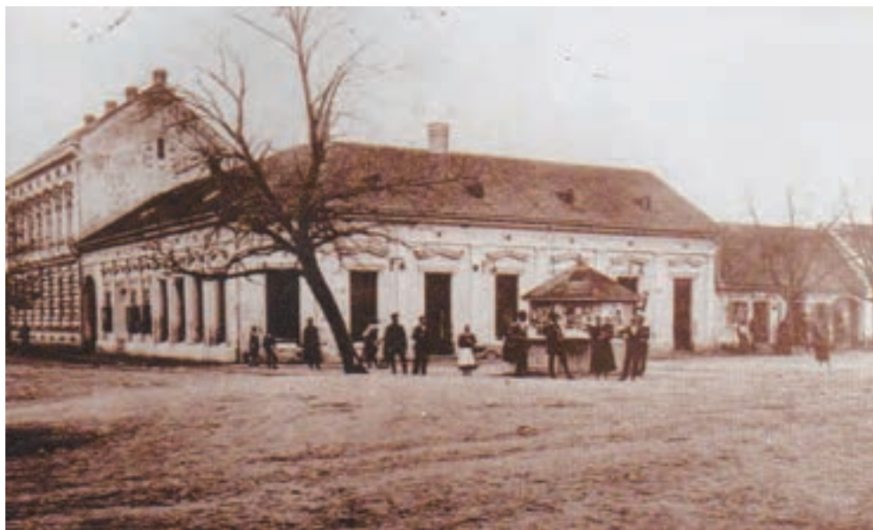
Centar Županje početkom 20. stoljeća

Od ukupna broja (3338 žitelja) stanovništvo su prema nacionalnoj osnovi iz popisa 1910. godine činili: 2505 Hrvata (75 %), 298 Nijemaca (8,9 %), 190 Srba (5,7 %), 143 Mađara (4,2 %), 49 Slovaka (1,5 %), 40 Židova (1,2 %), 13 Čeha, šest Slovenaca, sedam Talijana i 127 ostalih.