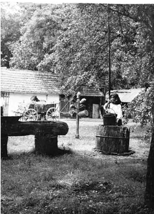
Đeram, bunar i korito

Bunar s drvenim „stubnjem” i „đermom” bio je nedaleko koljebe, a pokraj njega bilo je jedno ili više drvenih korita za pranje rublja, odnosno, kako se