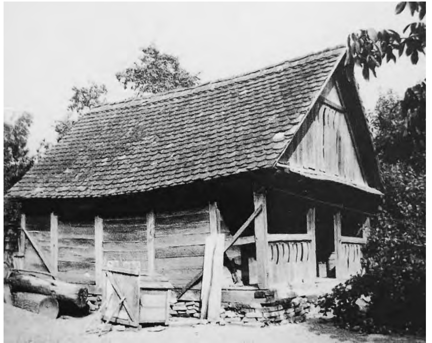
U ambaru su se spremale žitarice