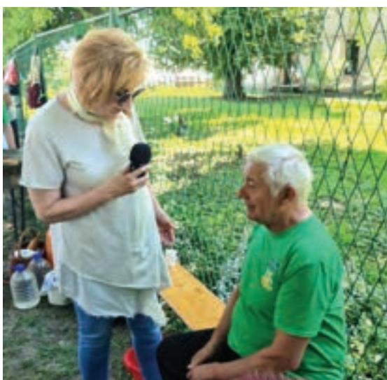
Mediji ga stvarno vole

Dan gradskih udruga održan je na Tijelovo, u parku restorana „Sava” i okupio je brojne građane našega grada. Članovi Športsko-ribolovnog društva Sava Županja pekli su riječnu ribu, članovi Lovačke udruge Gaj Županja pripremali su čobanac, dok su članovi i članice Udruge stanara šokačkih stanova Đeram Županja pripremali lepinjice (B. Galović-Dabić, Zdenka Knežević 2022: 188:17).