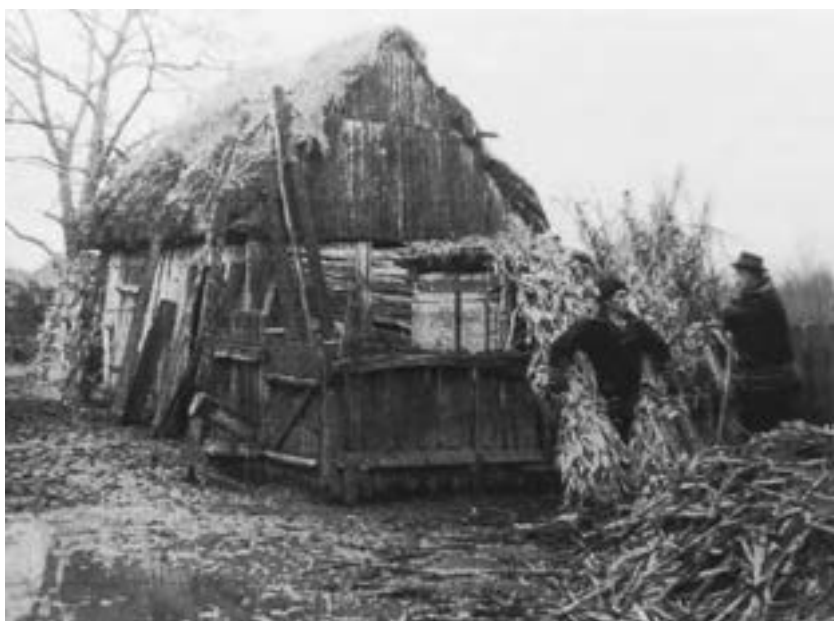
Pojata na stanu Ilije Pandurovića – Kristinog u Drenovcima

Zgrade za goveda bile su raznolike po gradnji i veličini. Obično su bile duge od 10 do 15 m, a široke od 4 od 7 m. Građene su od drveta, a jedino su ciglom bile podzidane. No i taj podzid bio je u ranija vremena od drveta, starih hrastovih panjeva zvanih „babe”. Pojata je bila otvorena cijelom stranom prema okolu na sredini kojega su bile dugačke drvene jase (većinom od pletera) iz kojih su goveda jela slamu i kukuružnjak. Na štalama su bila vrlo široka vrata, da goveda mogu lako ulaziti jer su imala duge i široke rogove, a i da bude svjetla kada se otvore jer u većini slučajeva nije na tim štalama bilo prozora ili su bili vrlo maleni.