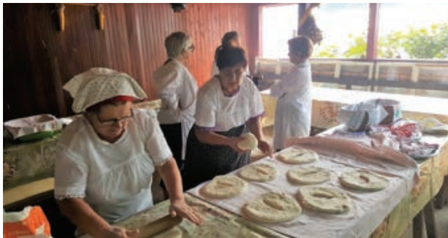
Priprema tijesta za kruh i lepinje