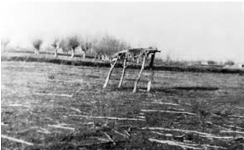
Sikirevci, nadstrešnica – skrovište za pastire

Sve do prvih decenija 20. stoljeća zadržali su se u Slavoniji i Baranji jednostavni, improvizirani zakloni od priručnoga drvenog materijala i zemlje. Uglavnom su ih koristili svinjari i čordaši kao privremena skloništa dok su čuvali stoku, osobito ako je stoka napasivana podalje od sela. U Sikirevcima je 1962. godine snimljena nadstrešnica na četiri stupa improvizirana od drveta i granja. Ovo pastirsko sklonište od pripeke i kiše najelementarniji je graditeljski oblik zabilježen u Slavoniji (Ž. Španiček 1995: 17–18).