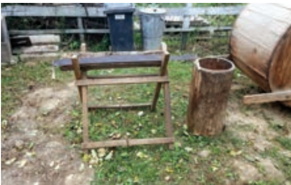
Koza, netko kaže jarac i pila