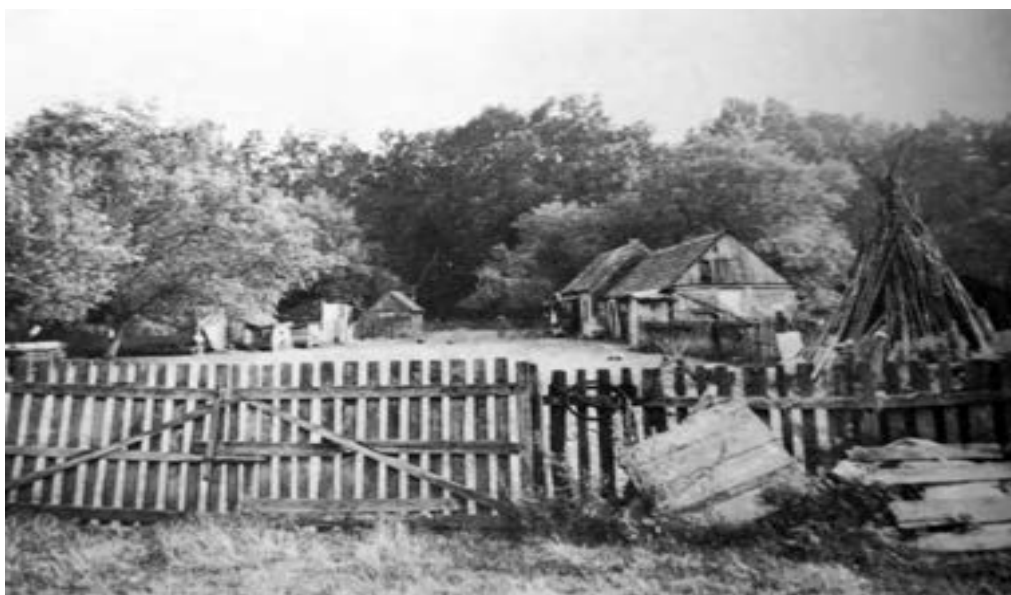
Gradište, stan zadruga Dretvić

U jesen kudgod pogledaš na stanu, svud je puno božjega blagoslova: štagljevi i guvna puni su žita, sjenici puni sijena, okoli puni marve, dvorište puno odrasle živadi, stabla puna zrela voća, vrt pun dozrela zelenja i raznoga povrća, mliječnjak pun bijeloga smoka, srca stanara puna utjehe i zadovoljstva. Slavonci sa stana izdržavaju dom i tko ima čestit stan i dom mu je dobar (M. Stojanović 1858: 35–37).