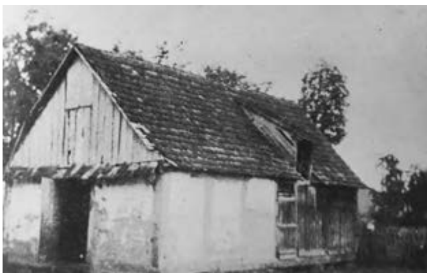
Govedska štala na stanu iz 1862. godine, Babina Greda