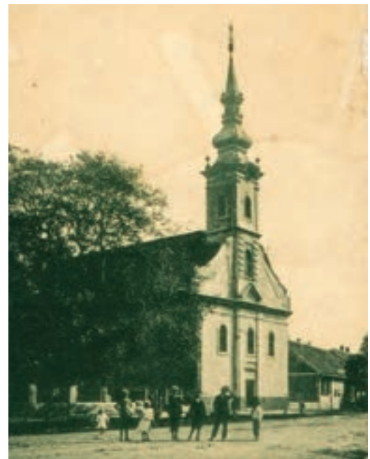
Crkva Župe Mučeništva sv. Ivana Krstitelja

Car Leopold I., je, prema preporuci Dvorskoga ratnog vijeća, naredio 14. rujna 1700. godine da se uredi Vojna krajina. Provedbom careve odredbe uspostavljena je konjanička (husarska) kompanija u Županji, što će pridonijeti administrativnoj važnosti samoga mjesta. Car Leopold I. 25. rujna 1701. godine po drugi put šalje grofa Caraffu u Slavoniju kako bi proveo feudalizaciju te popisao i podredio seosko stanovništvo vlasti Dvorske komore i osnovao Vojnu granicu. Popis mjesta i premjeravanje zemljišta početkom prosinca 1701. godine proveo je tridesetničar iz