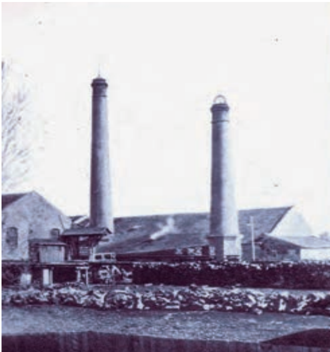
Tvornica tanina radila je do 1932. godine

Županija doživljava ubrzaniji razvoj nakon sredine 19. stoljeća razvojem robnonovčane privrede. Razvojačenjem Vojne krajine 1873. godine i konačnim ukidanjem 1881. godine, plodna i bogata slavonska područja svojom su privlačnošću i jeftinom tržišnom cijenom zemljišta postala izazov stranim i domaćim trgovcima, industrijalcima i poduzetnicima. Počinje drvoprerađivačka proizvodnja, engleski i francuski industrijalci 1880. godine grade poznatu tvornicu tanina ( The Oak Extract Company Limited ), a nekoliko godina poslije i tvornicu bačava u kojima zapošljavaju oko 400 radnika. Engleske obitelji sa sobom donose kapital, ali i stečene građanske navike i običaje te su u županjsku svakodnevnicu uveli razne navade, poput igranja nogometa, tenisa, hokeja na travi, mačevanja i lova. Godine 1812. Županija ima 1600 stanovnika, a na popisu 1890. godine broj je narastao na 3467. Dakle, broj se udvostručio zbog doseljavanja stanovnika koji su radili u tvornici ili otvarali obrte. Prema vjeroispovijesti ukupno je bilo 3133 rimokatolika (90 %), šest grkokatolika, 138 pravoslavaca (4 %), 54 židova (1,5 %), 135 evangelika (3,9 %) i jedan nepoznat (Prutki 2018: 25).