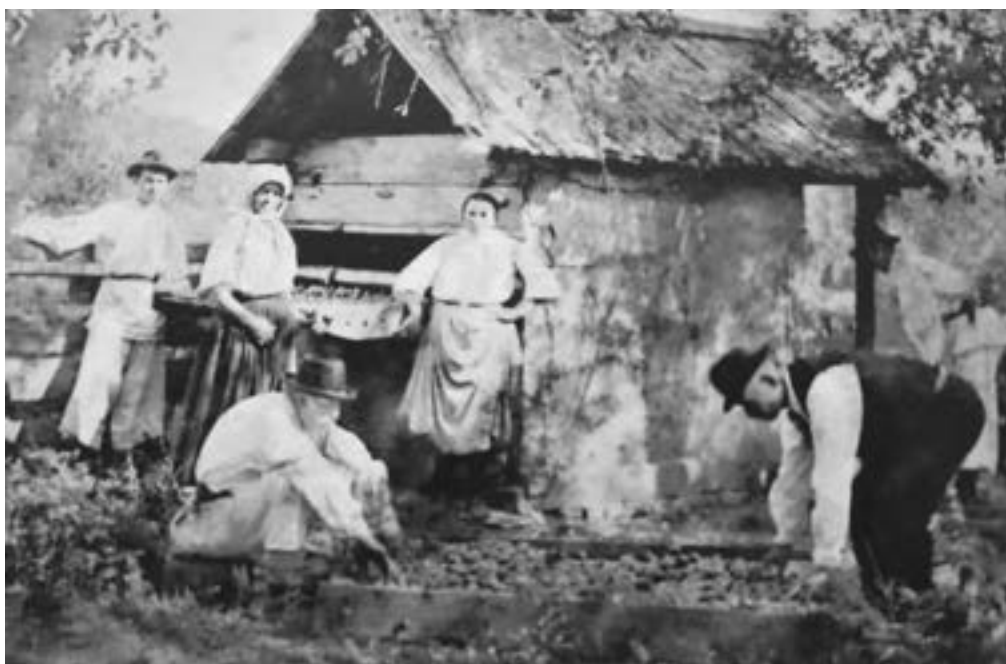
Sušenje voća („ošap”) oko 1900. godine

Od zemljišta bitno je spomenuti bašču (vrt), šljivik, nešto vlastite šume, livade za pašnjak te obradivo zemljište.