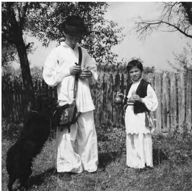
Šaranje tikvica na stanu uz pulina

Stanar se brinuo za stoku koju su čuvala odrasla djeca koja su bila na stanu ili su dolazila iz doma. A često je stoku čuvao i sâm stanar. Žena je radila svoje poslove oko kuće, u vrtu i oko živadi, a osim toga bavila se i ručnim radom: tkala, prela, vezla, rasplitala, šlingala i krpala itd. Sve što je na stanu privređivala stanarica pa i što je jaja skupila bilo je njezino i mogla je tim slobodno raspolagati. Ona je i mlijeko sirila, sušila sir, kupila kajmak, topila ga u maslo ili ga solila i spremala za zimu, odnosno za poslove.