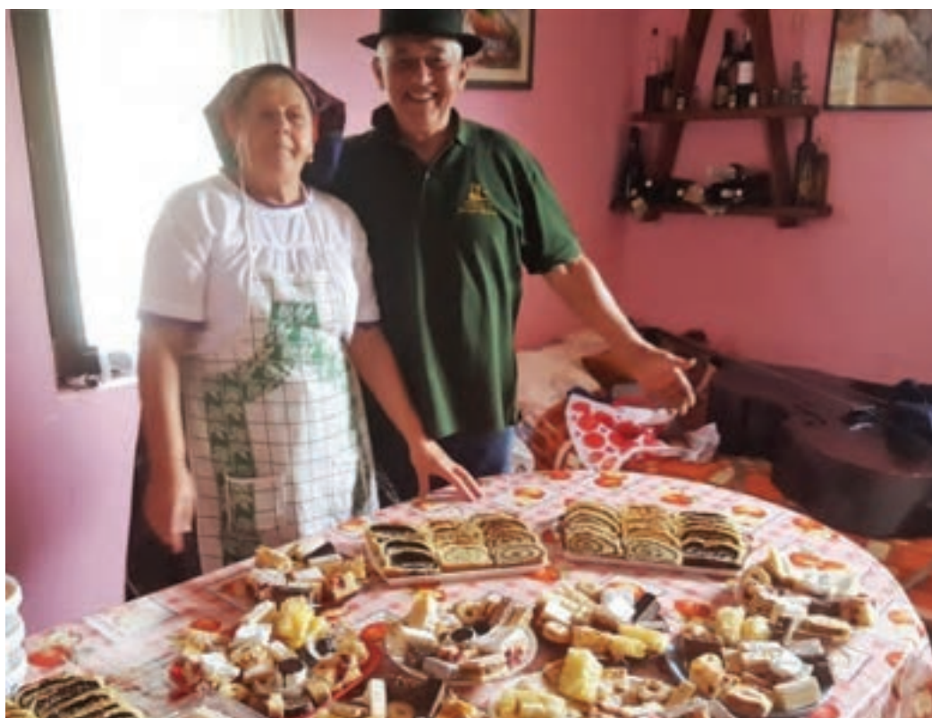
Ima svega pa i raznih vrsta kolača