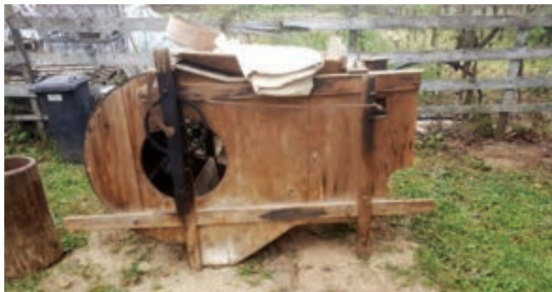
Vijara za odstranjivanje nečistoća u krupnijim žitaricama za sjetvu