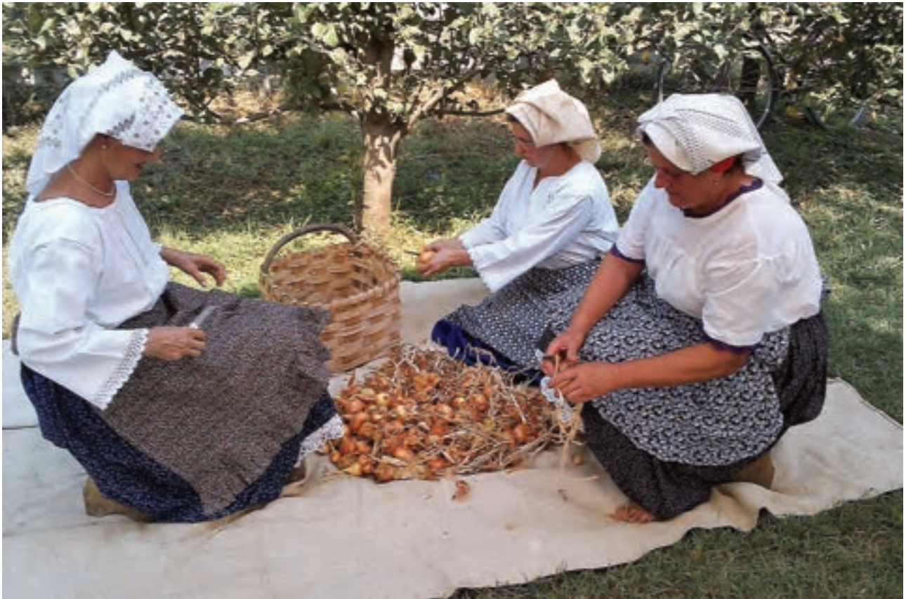
Oživljene su zaboravljene slike iz prošlosti