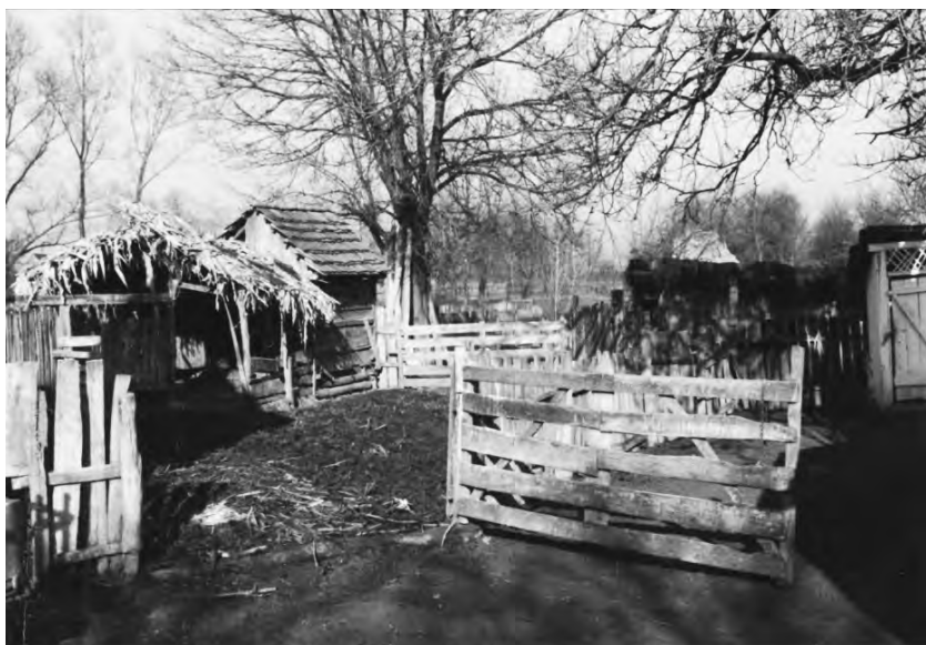
Okol, ograđeni dio za stoku