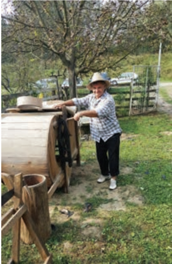
Vijanje zobi za sjetvu