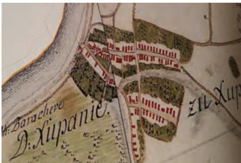
Vojna karta Slavonije 1763. – 1787. godine

Svećenici u Vojnoj krajini nisu bili pod upravom svoga ordinarija, nego pod zapovjedništvom generalkomande, tj. njezina Odjela za bogoštovlje. Njihov položaj (namještanje, premještanje) bio je takav da su ovisili tek o višim vojnim zapovjedništvima kao i svaki drugi časnik. Županja je u takvome ustroju postala sjedište 11. satnije u sastavu Brodske graničarske koja je svoje sjedište imala u Vinkovcima. Vlasti su u ove krajeve bile primorane naseljavati i strano stanovništvo, i to uglavnom kako bi se razvio obrt, trgovina. Na temelju obavljene kanonske vizitacije 1755. godine, u Županji je ukupno živjelo 137 parova raspodijeljenih u 73 graničarske kućne zadruge, a broj stanovništva iznosio je preko 1300.