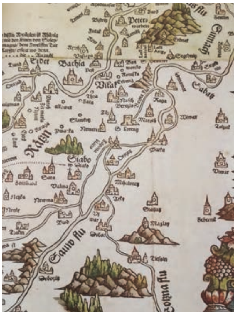
Dio Karte Ugarske iz 1528. godine (autor Lazar) u kojoj je Županja ucrtana kao Zupania Blacia

Ime grada Županje nalazi se prvi put zapisano na karti 1528. godine kao Zupaniablata. No prije toga na prostoru sadašnjega županjskog zemljišta, 1476. godine, postojala su mjesta Trtavci, Karaševo, Krutanovci i Miljevci koji su pripadali naselju Selna. Ime Županje Blato zabilježeno je 1729. godine u vizitaciji pečuškoga biskupa. Poslije toga ono postepeno nestaje, a ostao je samo oblik Županje, koji se govorio i do početka 20. stoljeća.