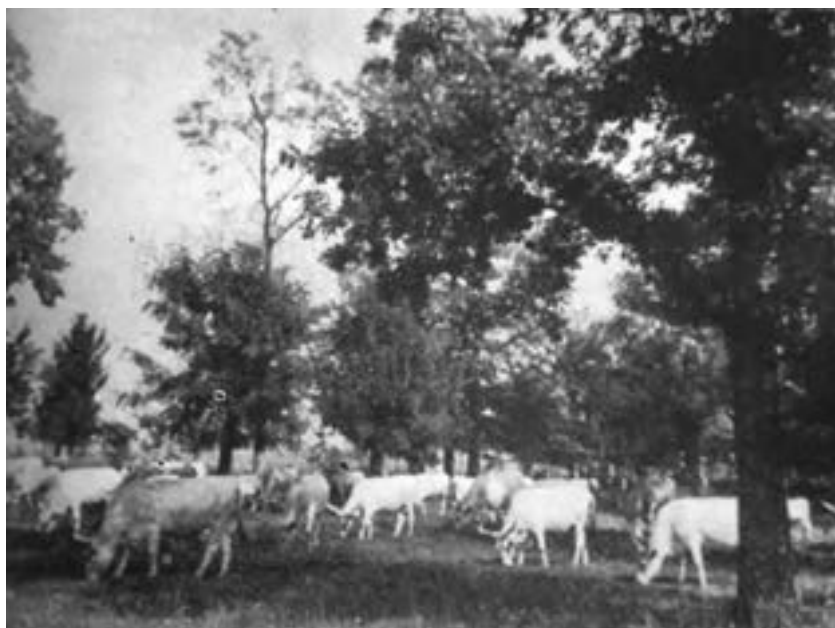
Pašnjak u blizini šume

Općine su također mogle iz imovnih šuma dobiti potrebnu građu za javne zgrade (crkvu, školu, mostove, groblje, ogradu sajmišta ili strviništa itd.).