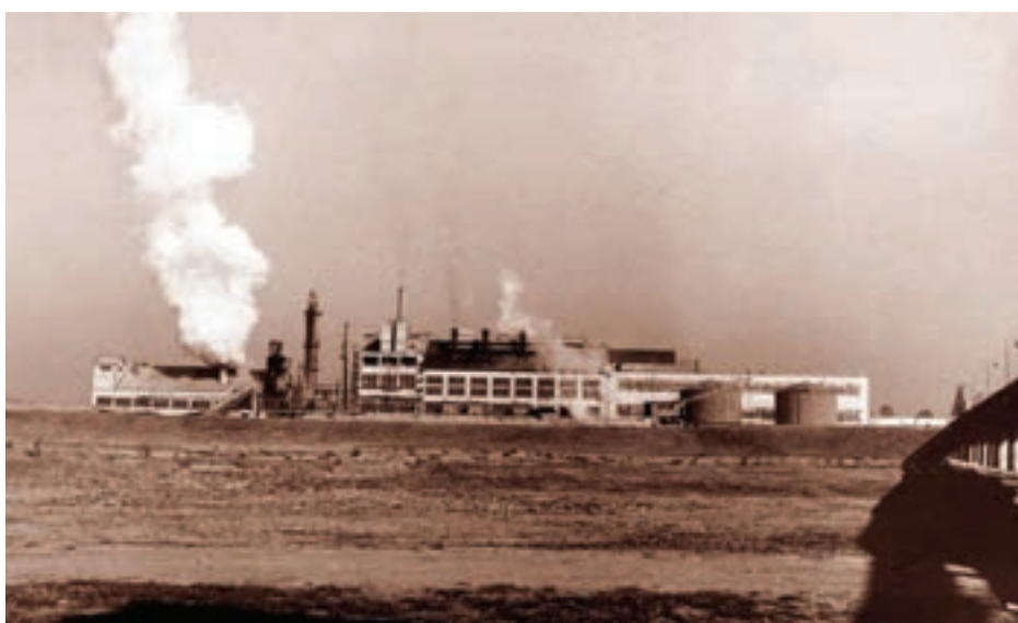
Sladorana je od 1947. godine okosnica ekonomskoga i društvenoga razvoja

Izgradnjom tvornice šećera 1947. godine došlo je do vidnoga napretka u ekonomskom i društvenom životu. Kotarsko-nabavnoprodajno poduzeće na malo Posavina formirana je 1947. godine, a Veterinarska stanica 1949. godine, kao i Mlinsko-pecharska tvornica Slavonija . Intenzivira se proizvodnja ratarskih i stočarskih proizvoda, Poljoprivredna zadruga Napredak se od 1952. godine pojavljuje kao poslovni partner seljacima.