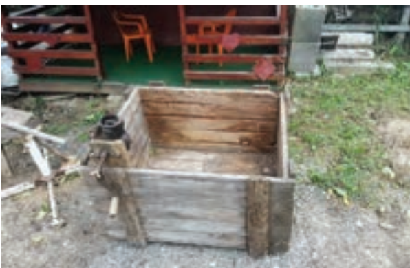
Sanduk i ručni krunjač kukuruza u klipu (testera) za rezanje drva