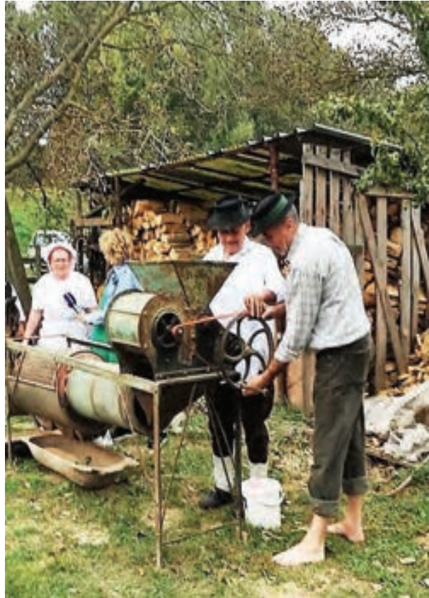
Čišćenje pšenice za sjetvu