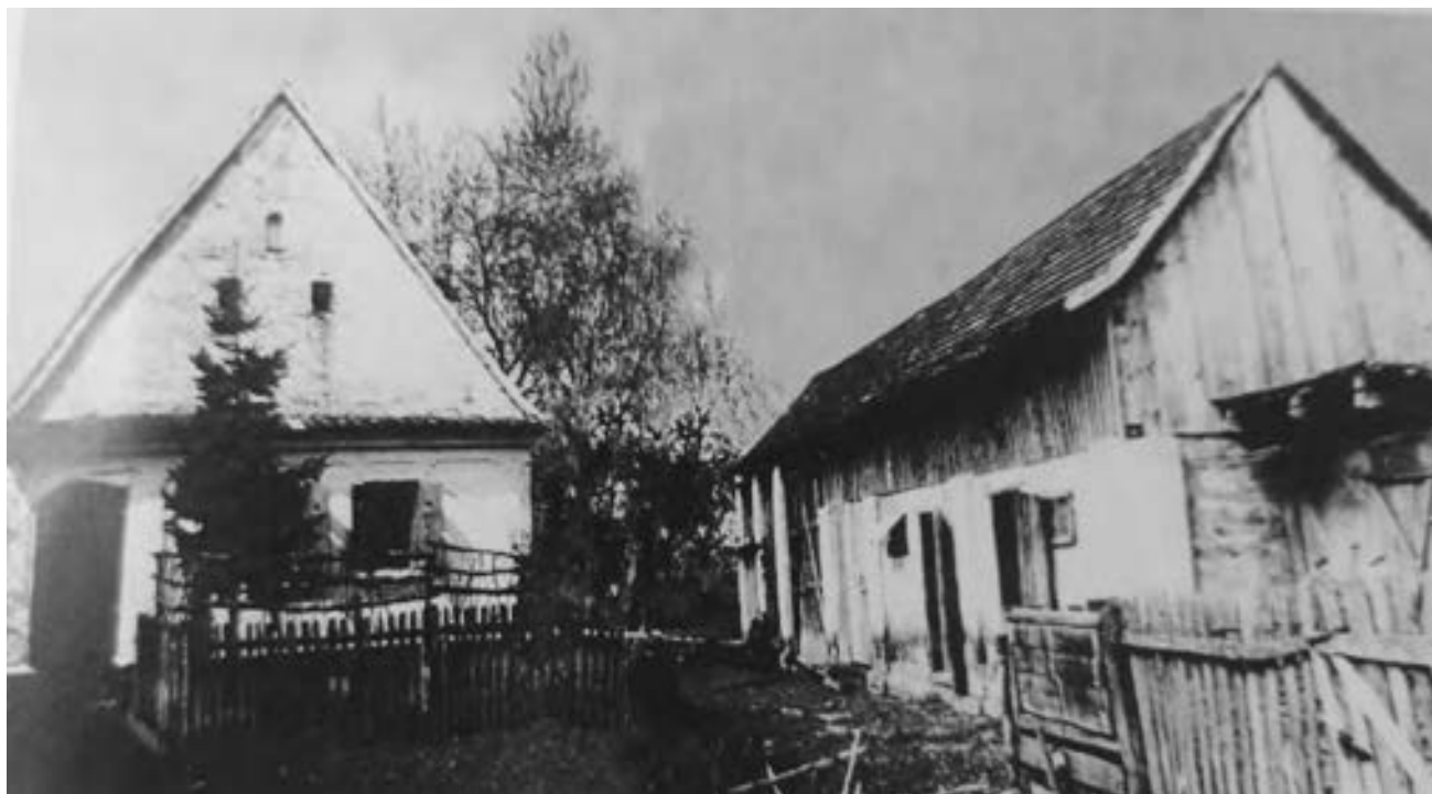
Balentović – Šokičin stan 1964. godine (hatar Dubarkovo)

U najvećem dijelu spomenutoga razdoblja živjelo se na selu u kućnim zadrugama, a izvan njih je bilo malo ljudi i to su bili ponajviše obrtnici, službenici općine i škole te šumari, lugari, trgovci i umirovljenici i dr. U zadrugama je obično bilo po više obitelji, čiji su članovi živjeli na zajedničkom posjedu (gruntu) i u zajedničkoj kući u selu, a „stanovi” (salaši) bili su zapravo drugi dom, obično za jednu obitelj.