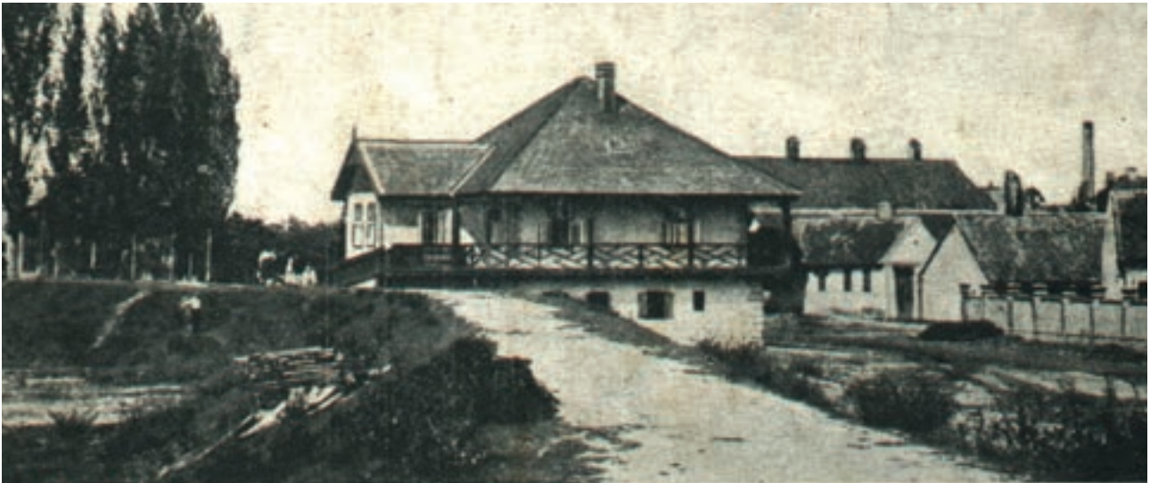
Nekadašnja stražarnica, današnji Muzej

Gradiške Mathias Adam Filler uz pomoć vojnoga inženjera i satnika Gaspara Dorcka. Fillerov popis Županje (Szoboniblado) donosi tada podatak da u mjestu ima „kuća 60, zemljišta ukupno 1290 jutara, od kojih 800 jutara plavi visoka voda”. Da je u Županji (Suppania Blata) stvarno bilo smješteno zapovjedništvo husarske kompanije, svjedoči i izvještaj grofa Caraffe o izvršavanju Careva naloga te uspostavi Vojne krajine od 25. listopada 1702. godine.