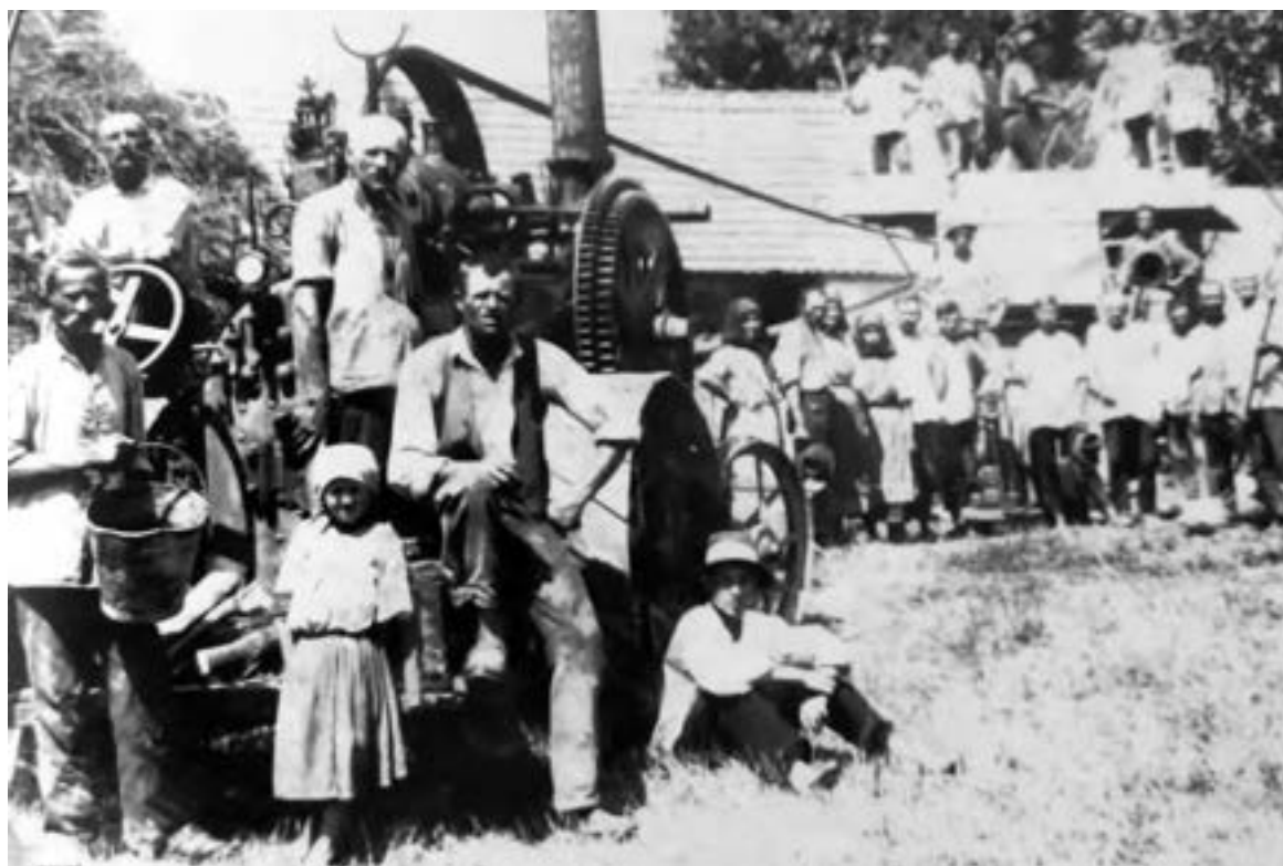
Vršaj u Štitaru 1936. godine

Sva ostala stoka (goveda, ovce i svinje) kao i radni konji, kobile, ždrebadi i omad – bila je na stanu. Konji su se držali u ograđenim pašnjacima, da budu pri ruci, kada ih treba upreći za kakav posao. Osim drljanja i vožnje žita („svažanje”, „uvažavanje”) najviše su se upotrebljavali za vršidbu koja je trajala dulje vremena, jer tada nije bilo vršalica, nego se sve vršilo konjima.