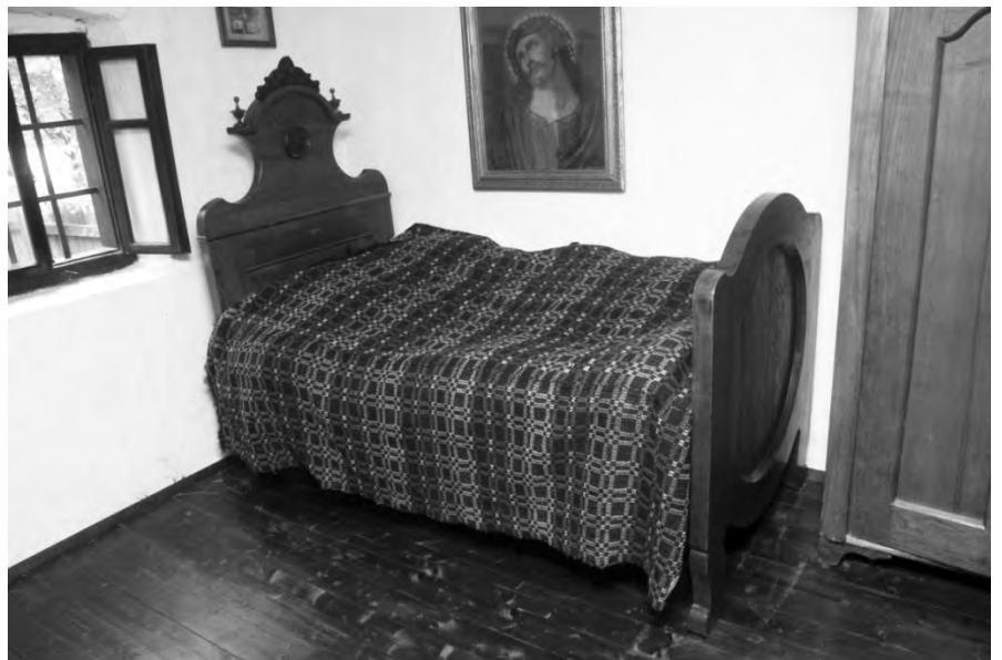
Krevet i soba za spavanje

Osim doma u selu, gdje se više zadržavalo zimi, svaka zadruga imala je i „stan” (salaš), koji je zapravo bio drugi dom. On se nalazio obično tamo gdje je bilo najviše posjeda ili pokraj šume ili pašnjaka, da se može lakše držati stoka koja se gotovo sva i držala na stanu. Uz takav način života u zadrugi, a uz brojne pašnjake i šume razumljivo je da je stočarstvo, a ponajviše govedarstvo, bilo glavni temelj i izvor ekonomske snage tih zadruga i života toga prošlog vremena.